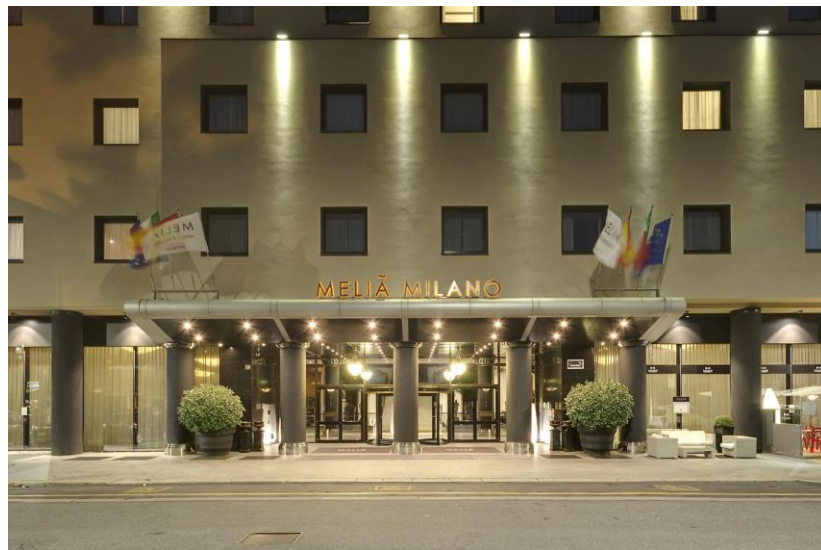
Grand Galà Dinner all'Hotel Melia - Milano